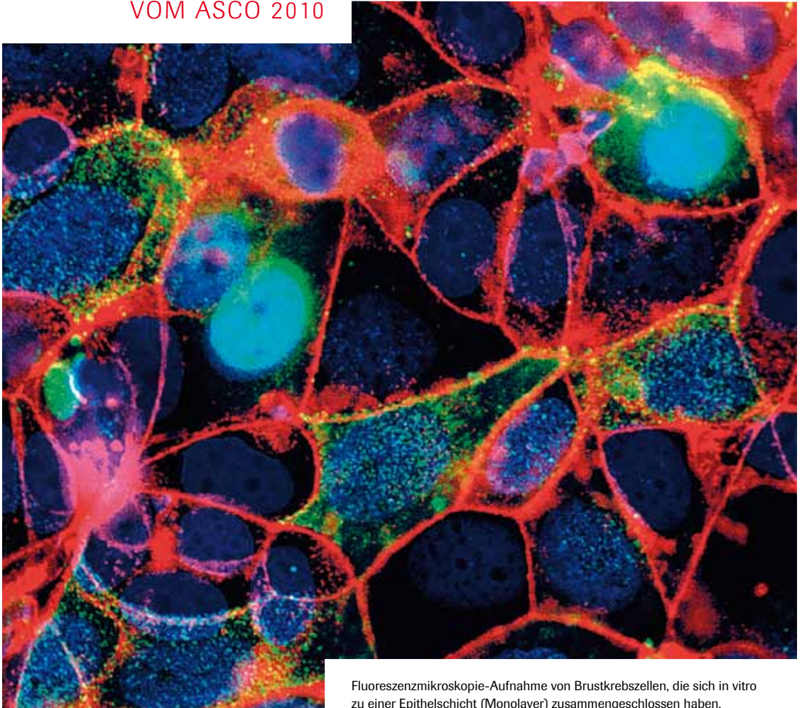
Fluoreszenzmikroskopie-Aufnahme von Brustkrebszellen, die sich in vitro zu einer Epithelschicht (Monolayer) zusammengeschlossen haben.

Einladung zur Fortbildung Dienstag, 22. Juni 2010 17.30 Uhr bis 19.00 Uhr im Au Premier, Hauptbahnhof Zürich